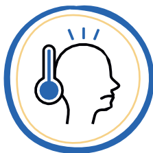
FIEBRE SOBRE 37.8°C

Dicho agente no permanece suspendido en aire, pero sí puede vivir por algunos periodos de tiempo fuera del cuerpo huésped, depositado en cualquier tipo de superficies. En la mayoría de los casos en que se ha presentado síntomas, estos son: