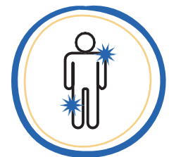
DOLORES MUSCULARES O CORPORALES