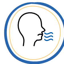
NÁUSEAS O VÓMITOS