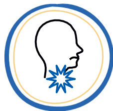
DOLOR DE GRAGANTA