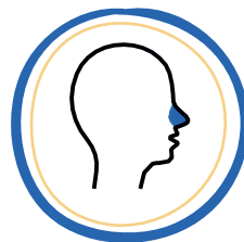
CONGESTIÓN O SECRECIÓN NASAL